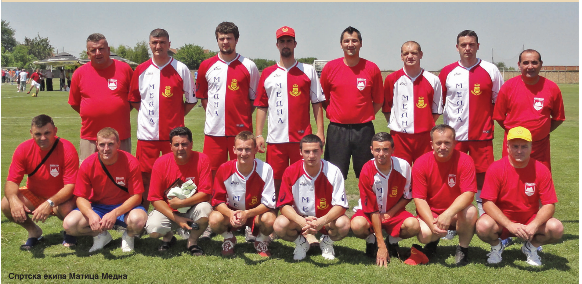
Спортска екипа Матица Медна