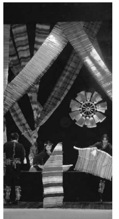
Детаљ са представе