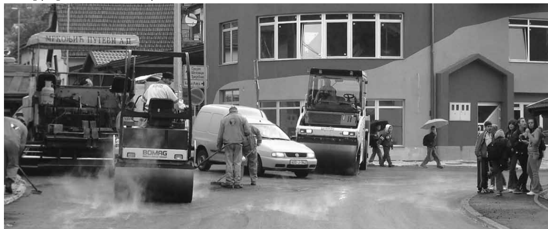
Асфалтирање улице Цара Душана

Веза - Улица Цара Душана уз транзитни пут једина је путна комуникација која Мркоњић Град повезује са Бањом Луком. Када се заврши реконструкција комплетне улице, то ће бити једна од најмодернијих градских саобраћајница.