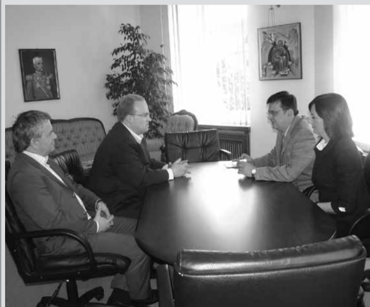
Замјеник Амбасадора САД у посјети Мркоњић Граду