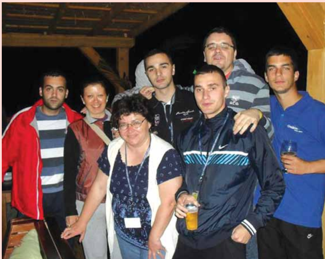
Побједничка екипа Шик радија и Независних новина