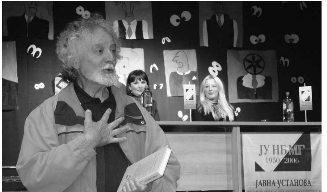
Казивање Добрице Ерића