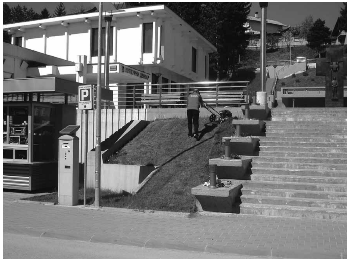
Чишћење зелених површина