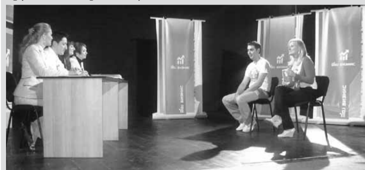
Детаљ са Аудиције