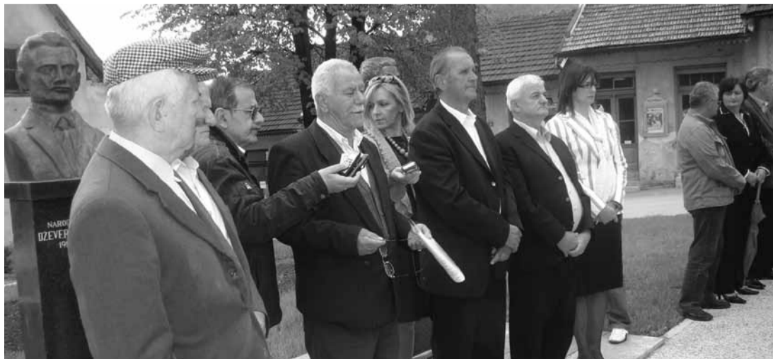
Делегација поред спомен - обиљежје НОР-у