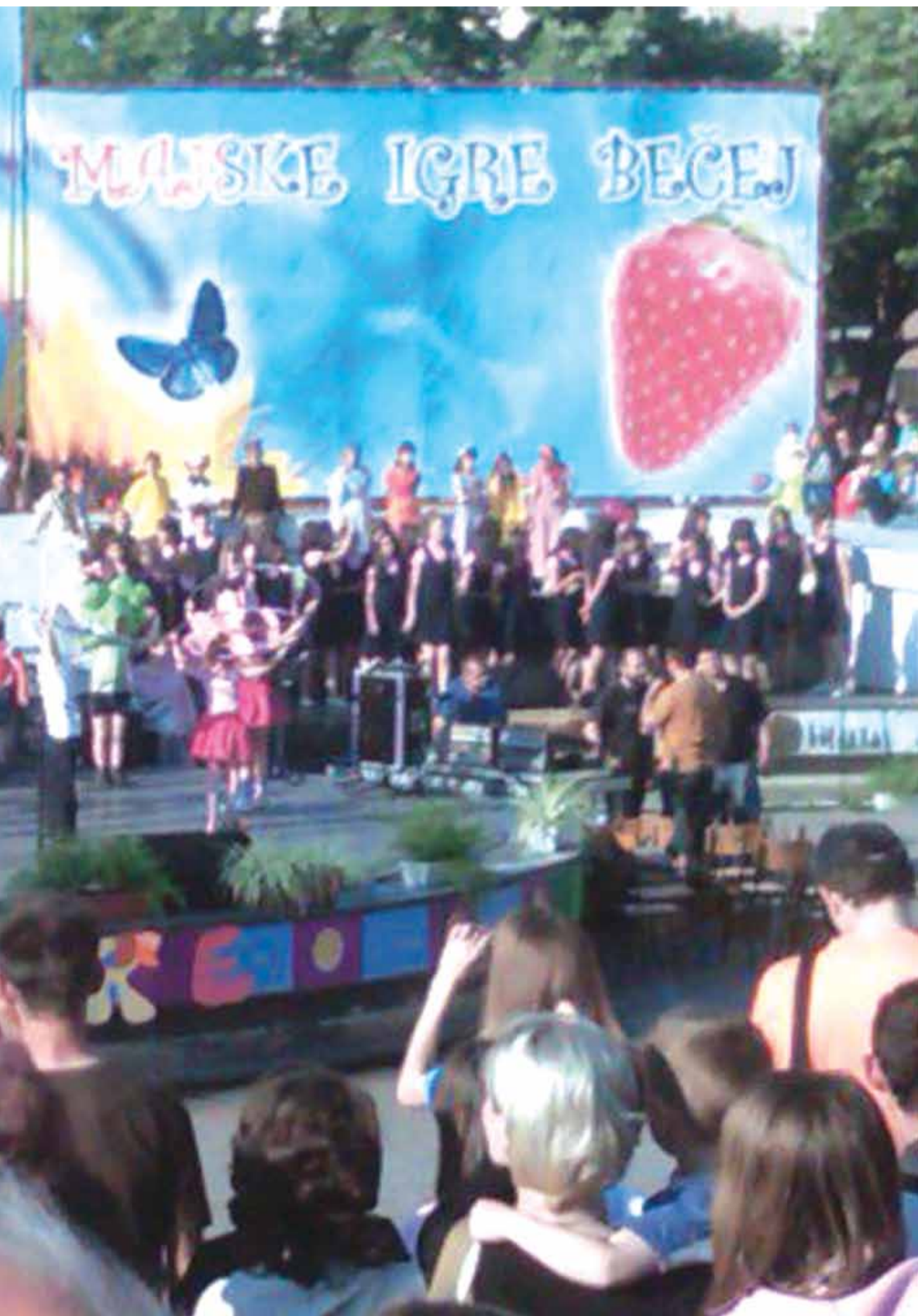
Са Мајских игара