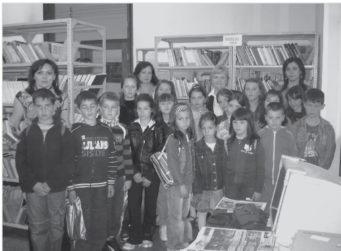
Ученици из Ораховљана у Народној библиотеци