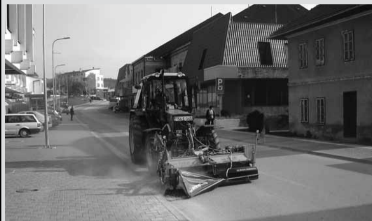
Чишћење градских улица

У нашем граду почели су обимни радови на уређењу улица, тргова, зелених површина, водотока... У првој седмици маја почели су радови на обнови и засаду нових засада цвијећа на зеленим површинама.