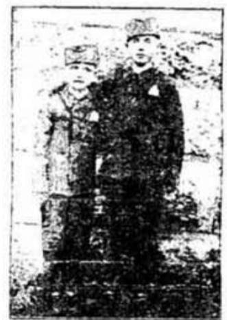
ПРИМЈЕР РАДА ХУМАНОГ ДРУШТВА "БЕДА"