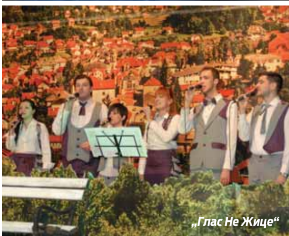
„Глас Не Жице“