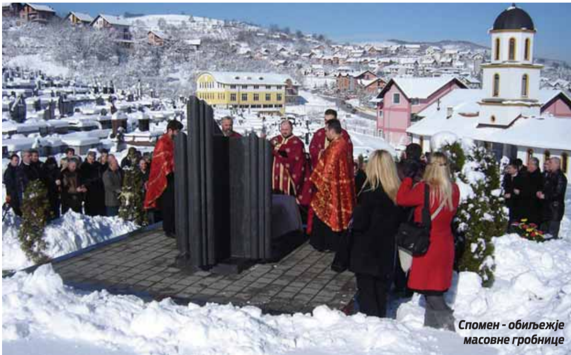
Спомен - обиљежје масовне гробнице

- Када је отворена масовна гробница слике су биле стравичне, све жртве су мучене и на звјерски начин убијене. Жалосно је што нико ништа конкретно не предузима да се покрене процесуирање одговорних за злочине, јер је очито да предмет лежи у фиокама судова и да то неко прикрива. Операцијом освајања Мркоњић Града и вршења масовних злочина командовао је Анте Готовина, којег је Хашки суд ослободио одговорности. Мислим да Хашки трибунал постоји само због интереса великих сила које преко наших лешева остварују