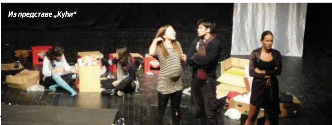
Из представе „Кући“