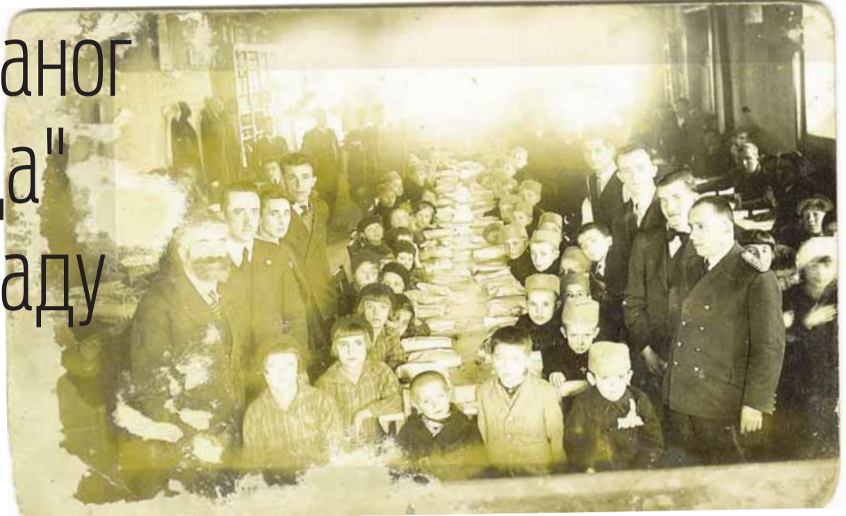
АКЦИЈА ХД "БЕДА": Чланови друштва са градским челницима, добротворима и сиротињском дјецом

(Врбаске новине, година IV, субота 21 јануар 1933. број 71. страна 6)