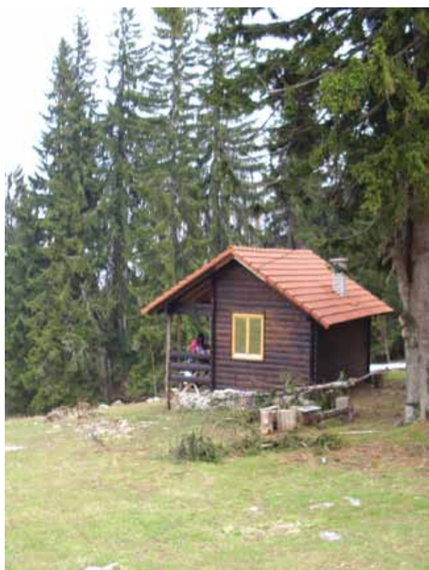
планински дом на Лисини