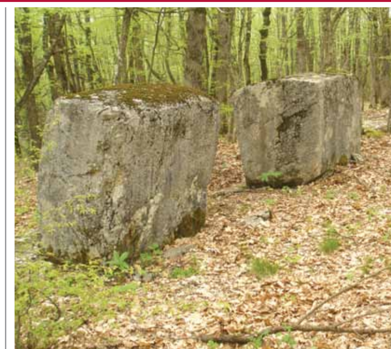
стећак у Баљвинама