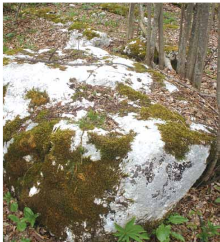
стећак у Томићима