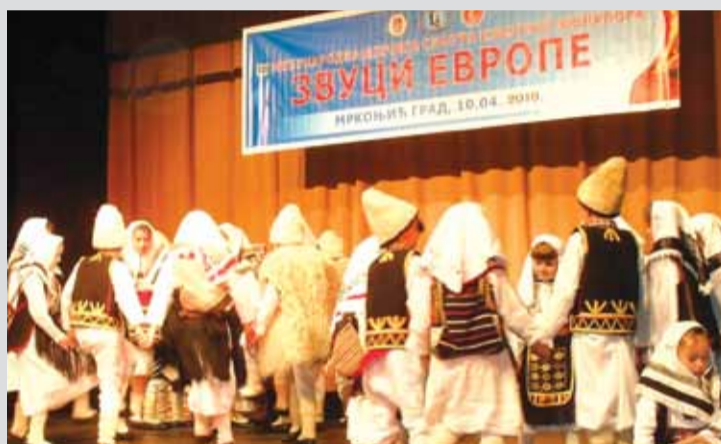
Млади фолклористи Мркоњић Града

Манифестација „Звуци Европе“ оправдала је своје постојање. Око 150 чувара народне традиције окупило се 10. априла у Мркоњић Граду како би показали своје умијеће у народном колу. У такмичарском дијелу манифестације, са кореографијама од по десет минута, наступила су Културно-умјетничка друштва: “Наша Младост” Кључ, “Грмеч” Дринић, “Чајавец” Бањалука, “Петар I Карађорђевић Мркоњић” Мркоњић Град те