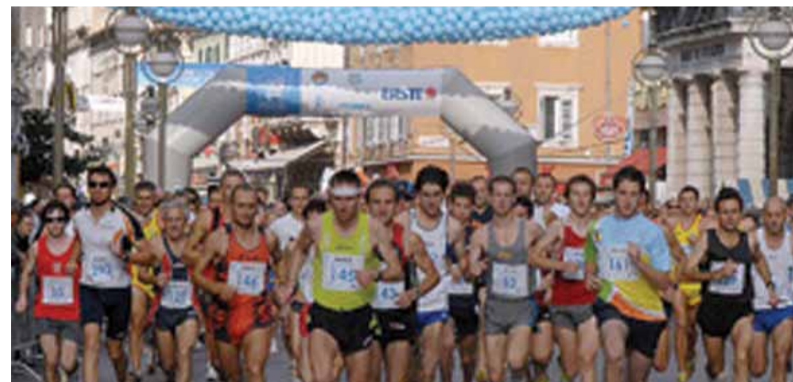
Са Ријечког маратона