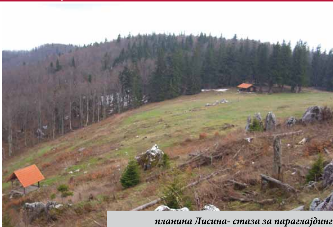
планина Лисина- стаза за параглајдинг