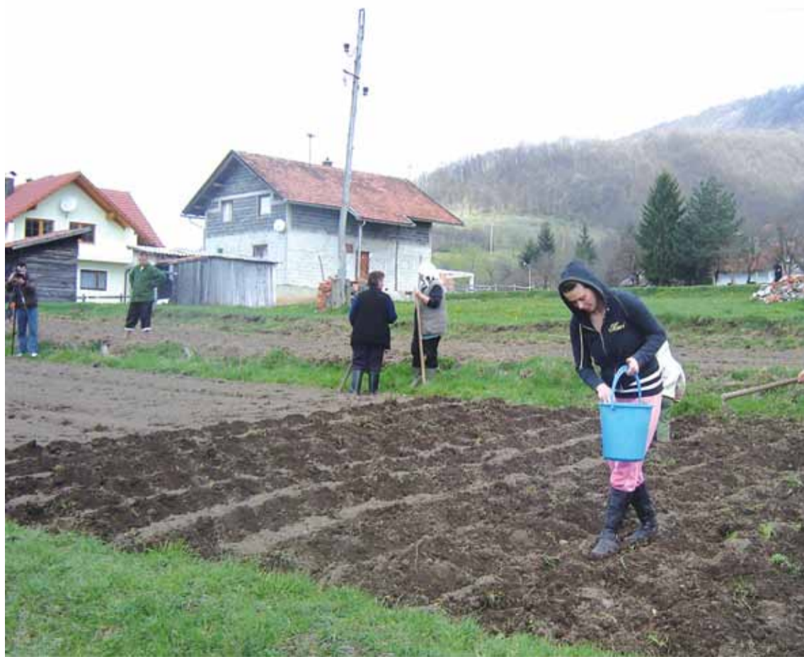
Ратари приводе крају прољећну сјетву