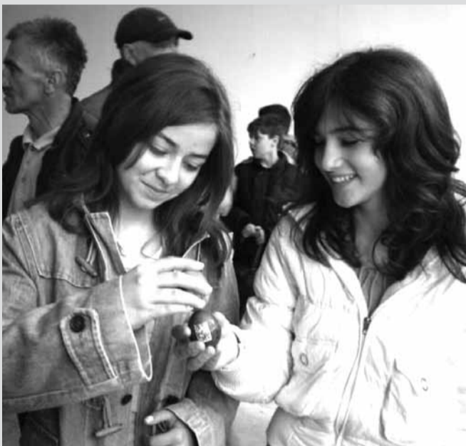
Млади чувари традиције Васкршњег сабора