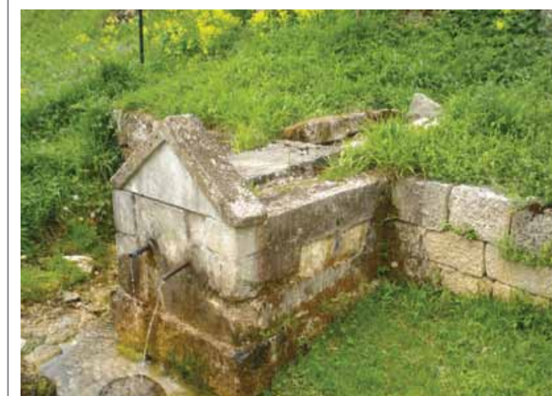
Горња Пецка - извор