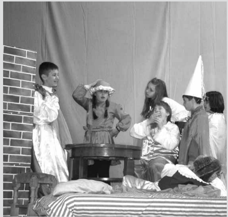
Дјечија представа “Плава птица”