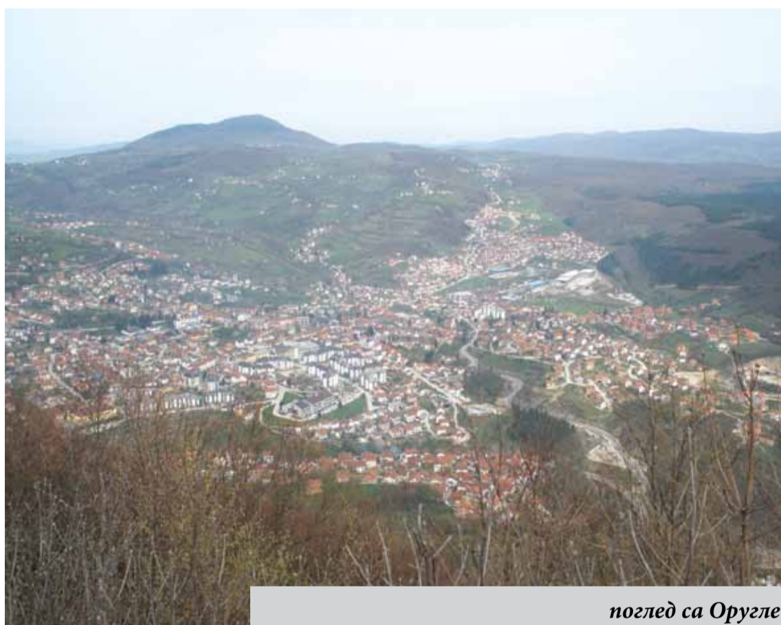
поглед са Оругле