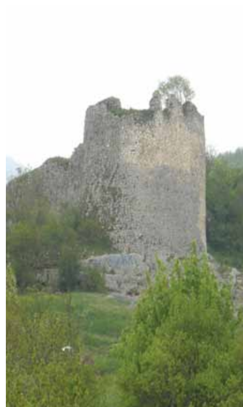
Кула - Бочац