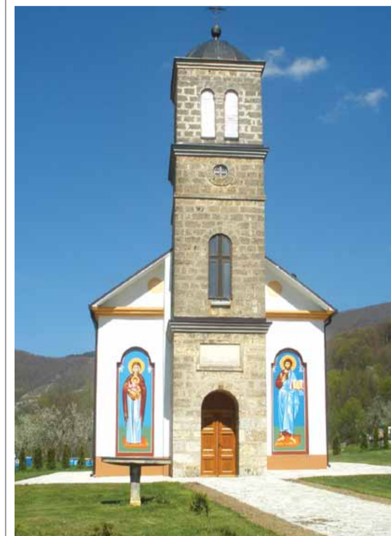
црква у Медној