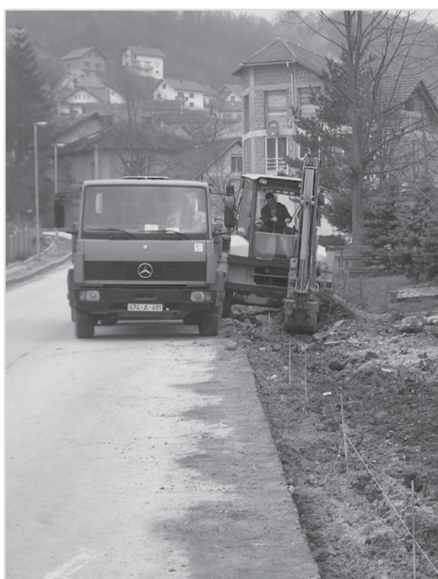
Нови тротоари у улици Цара Душана