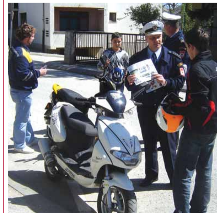
Акција МУП-а РС и АМС-а РС