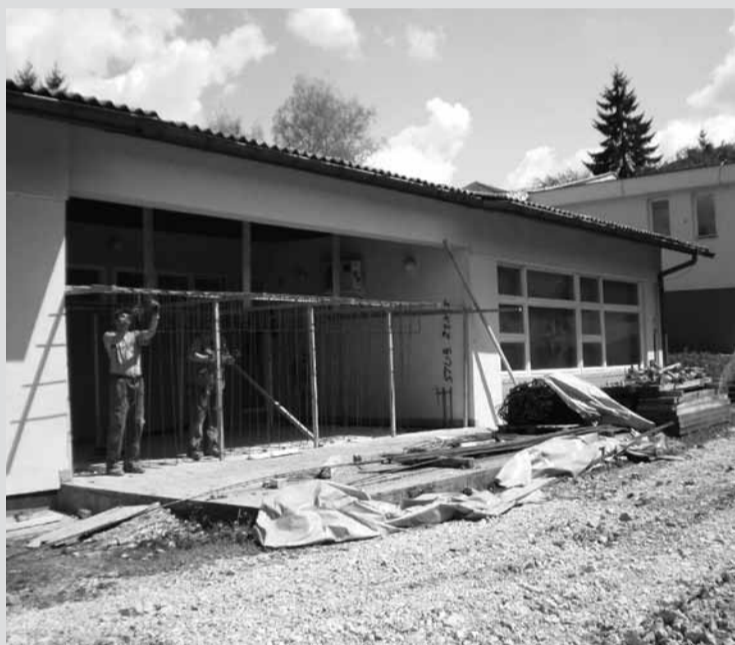
Радови на проширењу дјечијег вртића

До јесени, у Дјечијем вртићу “Миља Ђукановић” биће завршени радови на проширењу и опремању новог простора. Радове у јединој предшколској установи у нашем граду финансирају ГАР и општина, а извођач радова је предузеће “Комотин” из Јајца. По завршетку посла биће то један од најфункционалнијих простора за дјецу на нашим просторима.