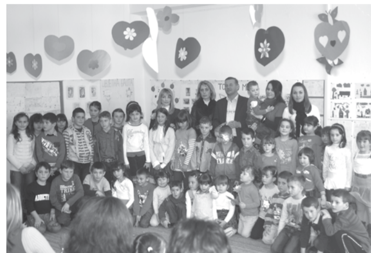
Са осмомартовске приредбе