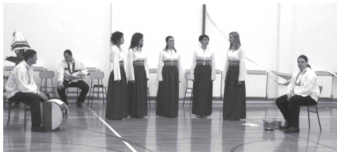
Етно група „Гора”