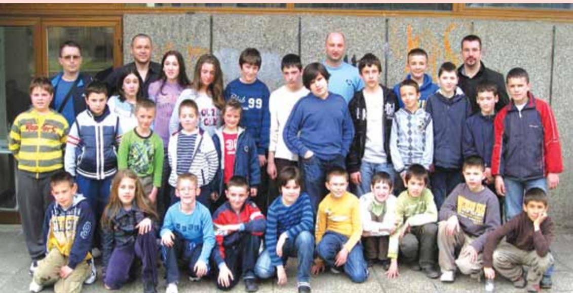
Учесници кадетске лиге регије Бања Лука

Други круг Кадетске лиге регије Бања Лука, одржан је у суботу 20. марта у Клубу војних пензионера. У овом кругу, Шаховски клуб "Ан пасан" остварио је по једну побједу и неријешен резултат. Тренутно су наши шахисти други на табели.