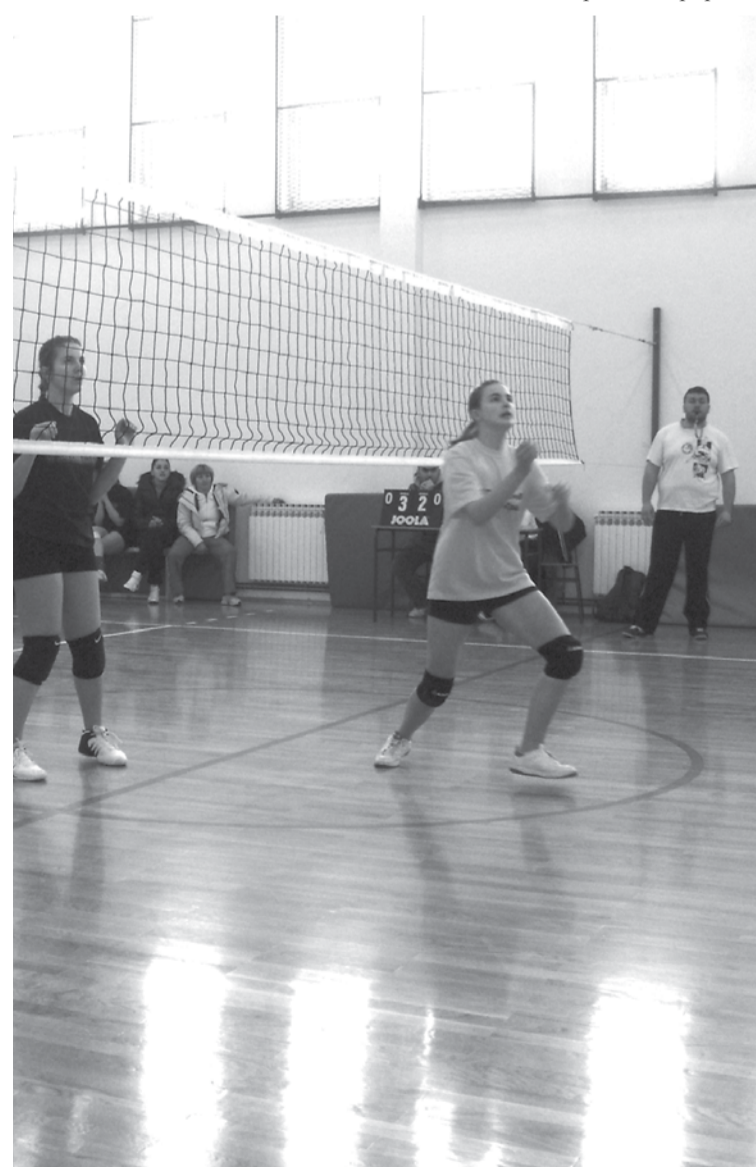
Мале олимпијске игре