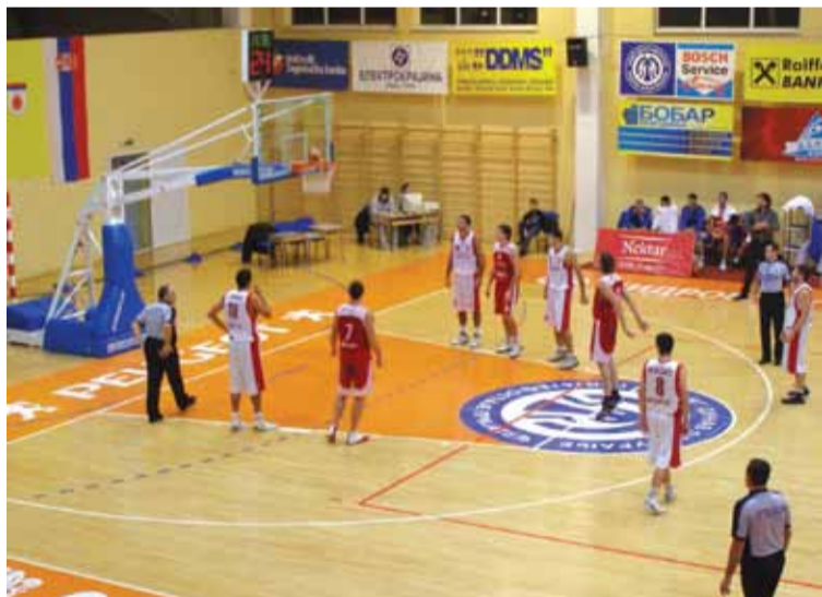
Завршен први дио кошаркашког првенства